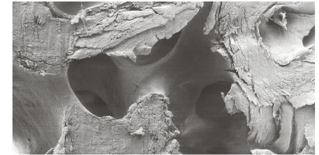
REM: MinerOss® A Knochenersatzmaterial

Im Anschluss laden wir Sie zu einem Abendessen mit fachlichem Austausch ins Restaurant Vetro, Stockholmer Allee 55 in 44269 Dortmund ein.